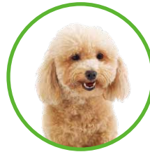
Chubby (12 歲) HK$2,822