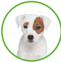
Dolly (2 歲) HK$1,921