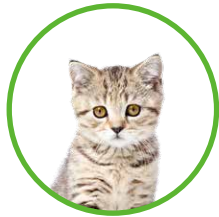
Lucky (1 歲) HK$1,537

假設一名保單持有人為以下寵物投保共享計劃，最終的保費支出為 HK$2,822 ，以保費最高的受保寵物應繳保費為準。